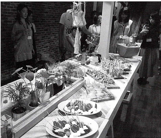
「おもてなしラボ」懇親会のイタリアン